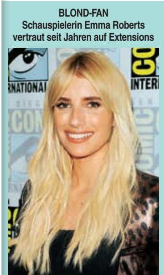
BLOND-FAN Schauspielerin Emma Roberts vertraut seit Jahren auf Extensions